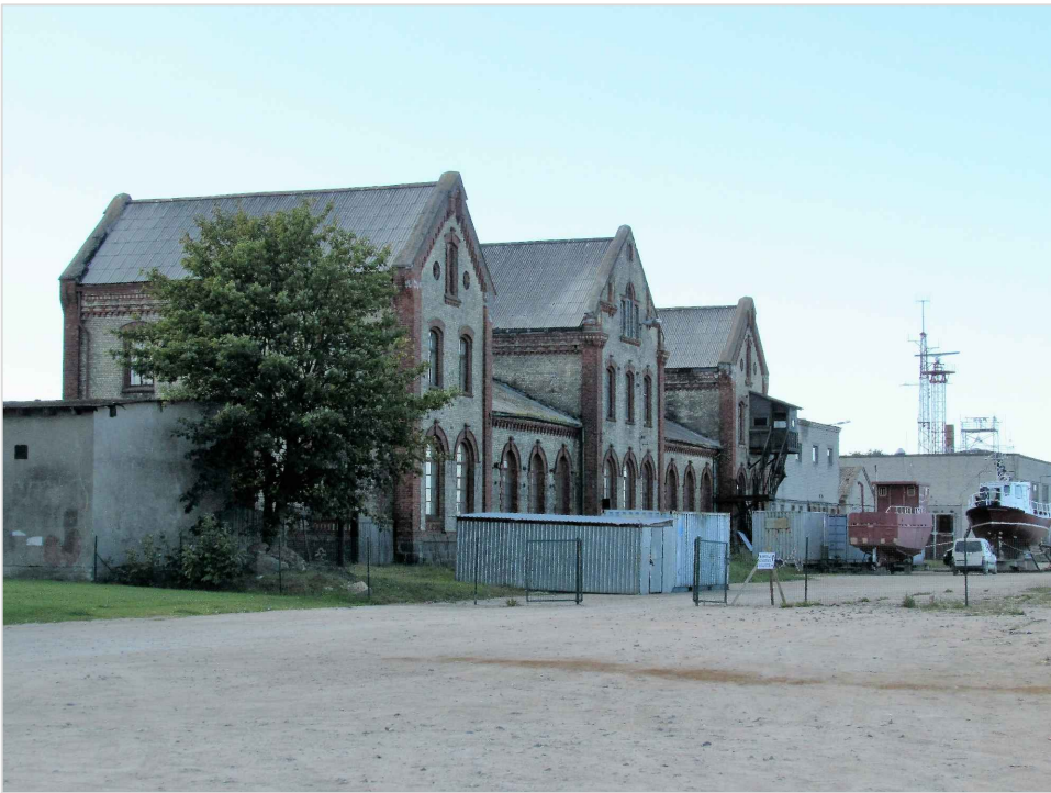
att. 3. Ēku komplekss skatā no krastmalas