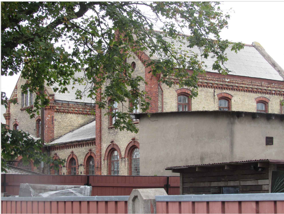
att. 4. Ēkas skatā no Valdemāra ielas. Korpusi 1-3.