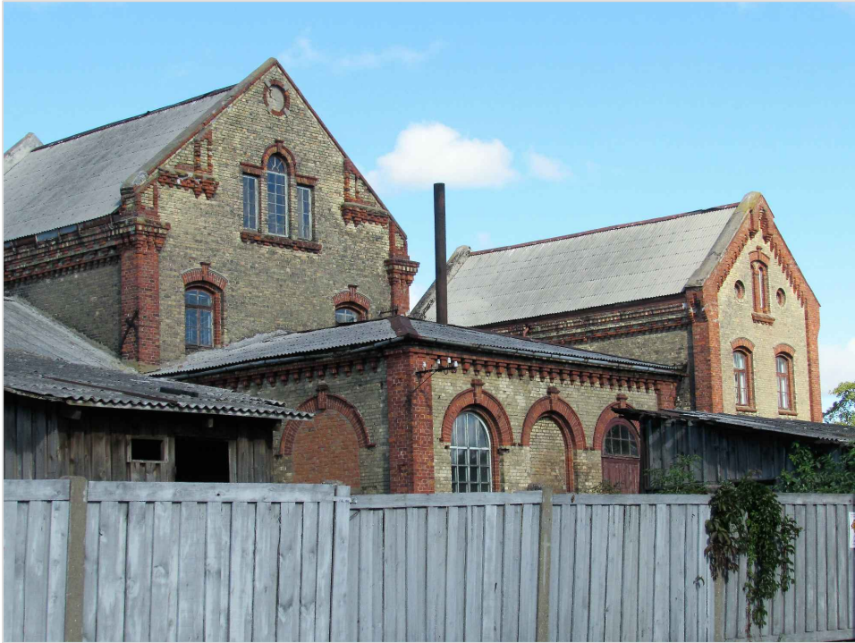
att. 5. Ēkas skatā no Valdemāra ielas. Korpusi 1, 2, 3, 6.