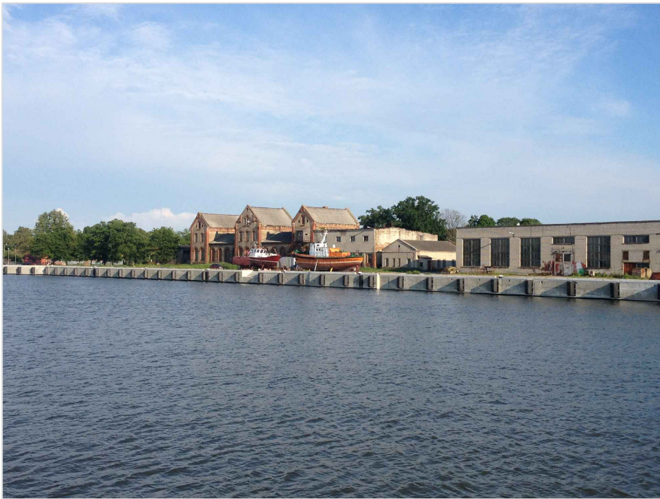
att. 2. Ēku komplekss skatā no Ventas.