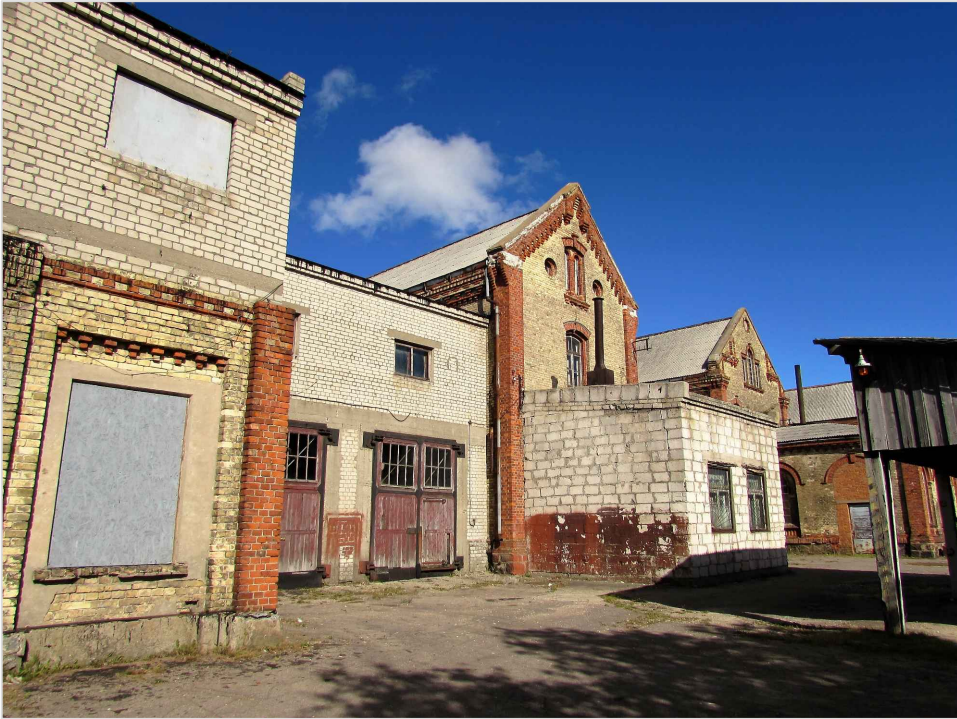
att. 6. Korpusi 7 un 5 skatā no teritorijas. Starp tiem XX gs. starpbūve D. Korpusam 5 priekšā XX gs. otrās puses piebūve B.